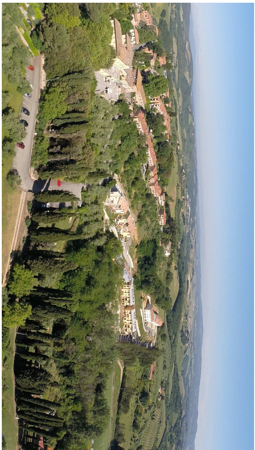
IMMAGINI FOTOGRAFICHE DEL CONTESTO